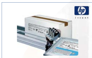
Impression jet d'encre