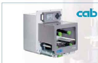
Imprimante transfert thermique OEM