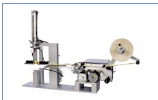
Version pneumatique «Marte 100PN»