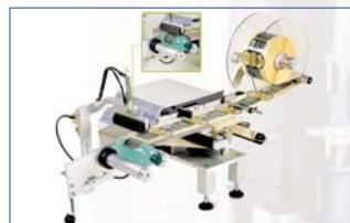
Version pneumatique «Marte 140PN»