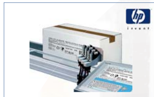
Impression jet d'encre