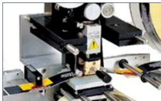
Impression à froid ou à chaud