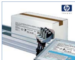
Impression jet d'encre