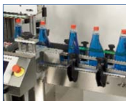
Centrer pour produits ovales