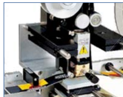
Impression à froid ou à chaud