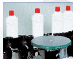
Séparateur de produits avant étiquetage