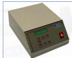
Mémoire 40 étiquettes