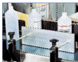
Banderolage latéral semi-enveloppant