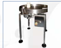
Table tournante Entrée / Sortie Ø 800 ou 1000 mm