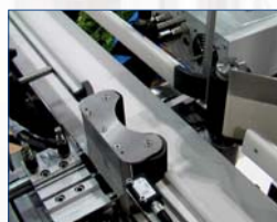
Banderolage complet enveloppant