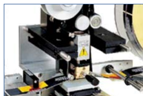
Impression à froid ou à chaud