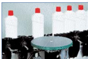
Séparateur de produits avant étiquetage