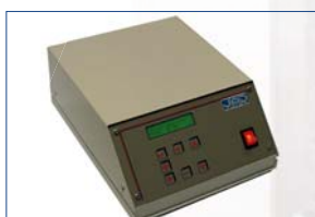
Mémoire 40 étiquettes