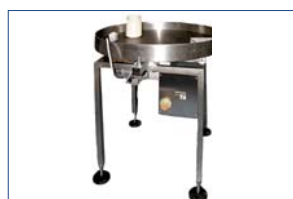
Table tournante Entrée / Sortie Ø 800 ou 1000 mm